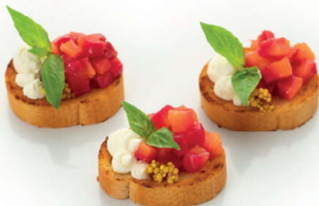
С СЕМГОЙ ГРАВЛАКС И СЫРОМ КРЕМЕТТЕ 60г. 240₽