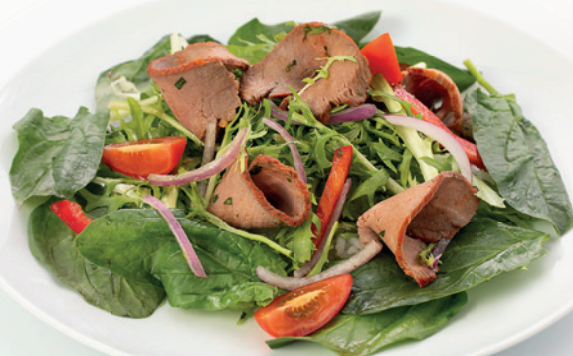
САЛАТ С РОСТБИФОМ 310г. 700₽ салат с говядиной, миксом зелени, помидорами черри, болгарским перцем, шпинатом и авторским соусом.