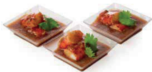
ФАЛАНГА КРАБА 90г. 780₽ В СОУСЕ БЛЕК ПЕППЕР