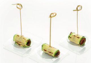
ЦУКИНИ С ВЯЛЕНЫМИ ТОМАТАМИ И МЯТНЫМ СОУСОМ 40г. 210₽