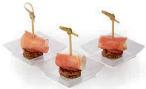
ПАРМА С КРАСНЫМ ПЕСТО 90г. 320₽ НА ХЛЕБНОЙ ПОДУШКЕ