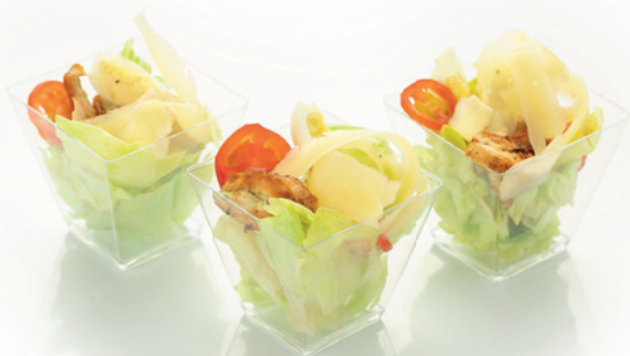
ЦЕЗАРЬ 60г. 260₽ салат с запеченными рулетиками из куриного филе, рукколой, перепелиными яйцами, сыром пармезан с соусом на основе карри