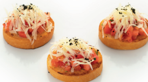
СО СПЕЛЫМИ ТОМАТАМИ И ПАРМЕЗАНОМ 80г. 160₽