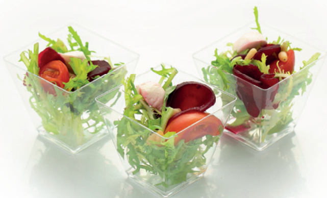
МАТРЕШКА 80г. 260₽ Микс зелени со слайсами печеной свеклы, творожным сыром, кедровыми орешками и соусом на основе чесночного масла и бальзамического крема