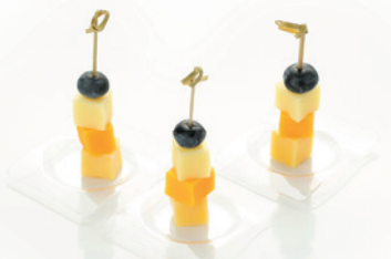
АССОРТИ СЫРОВ НА ШПАЖКЕ 65г. 330₽