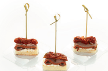
РОСТБИФ С ВЯЛЕНЫМИ ТОМАТАМИ НА ХЛЕБНОЙ ПОДУШКЕ 30г. 380₽