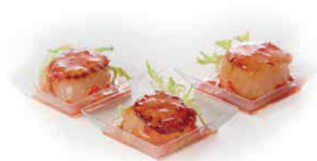
ПРИМОРСКИЙ ПАРНОЙ 90г. 460₽ ГРЕБЕШОК В СОУСЕ ЧИЛИ