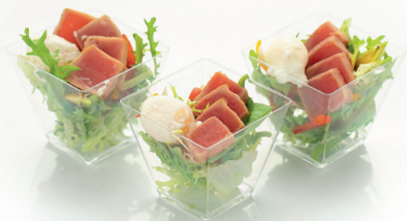
ГАТТО 96г. 340₽ Татаки из тунца с авокадо, миксом салатов, сладким перцем и яйцом пашот, под цитрусовым дрессингом