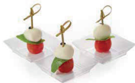
МИНИ КАПРЕЗЕ 90г. 270₽