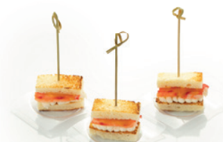
ФАЛАНГА КРАБА НА ХЛЕБНОЙ ПОДУШКЕ 30г. 410₽