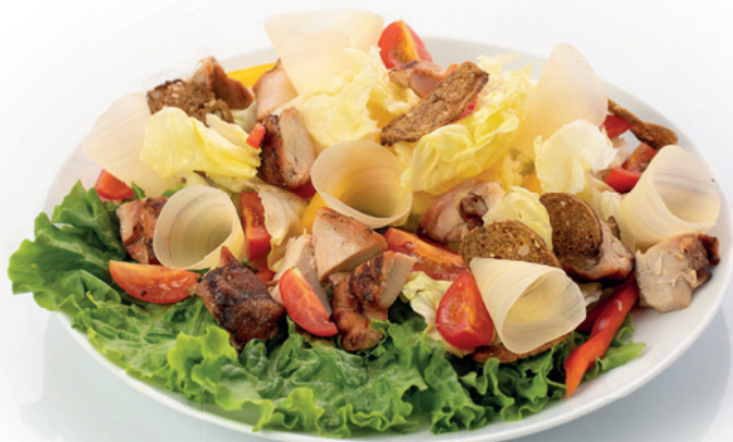
ЦЕЗАРЬ 490г. 750₽ салат с обжаренной курицей, салатом айсберг, помидорами черри, болгарским перцем, каперсами, сыром пармезан, хрустящими сухариками и соусом на основе Х.О.