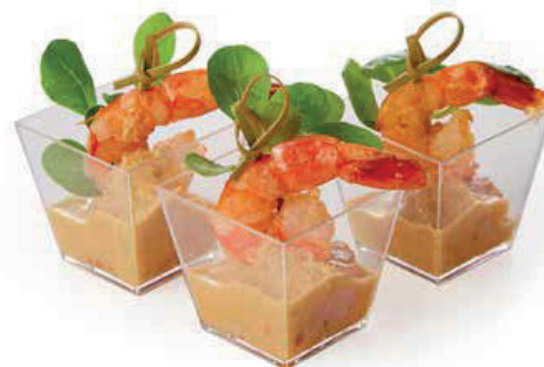
ГРЕБЕШОК С КРЕВЕТКОЙ 135г. 560₽ В СОУСЕ ТАЙ