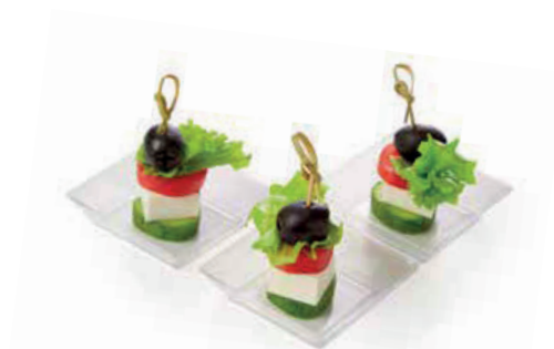
МИНИ ГРЕЧЕСКИЙ 90г. 260₽