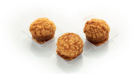
ПРОФИТРОЛИ С ЗАВАРНЫМ КРЕМОМ