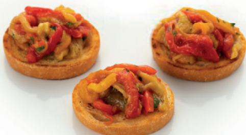
С ЗАПЕЧЕННЫМ ПЕРЦЕМ И БАКЛАЖАНОМ 57г. 160₽