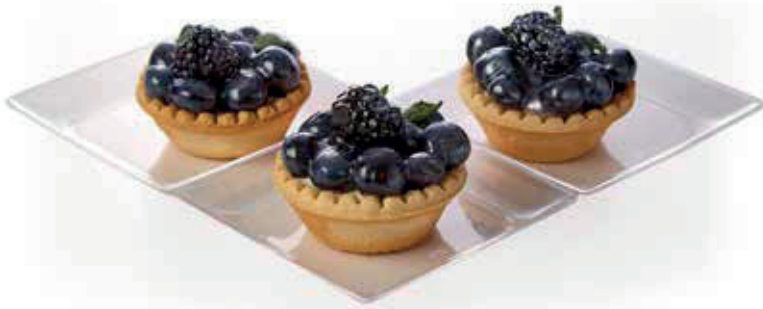
ПЕСОЧНАЯ КОРЗИНКА С КРЕМОМ И СВЕЖЕЙ ЯГОДОЙ