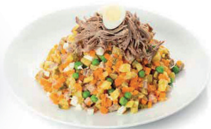
ОЛИВЬЕ 800г. 1200₽ салат с нежной говядиной, овощами, хрустящими корншонами, яйцом и зелёным горошком.