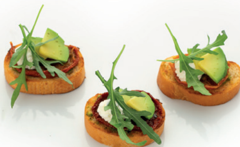
С ВЯЛЕНЫМИ ТОМАТАМИ, АВОКАДО, СЫРОМ КРЕМЕТТЕ И РУККОЛОЙ 60г. 220₽