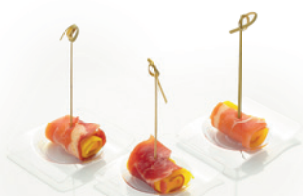
КАНАПЕ С ПАРМСКОЙ ВЕТЧИНОЙ И ГРУШЕЙ 45г. 250₽