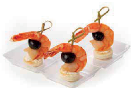
КРЕВЕТКА С МАСЛИНОЙ 105г. 360₽ И СЛИВОЧНЫМ СЫРОМ НА ХЛЕБНОЙ ПОДУШКЕ