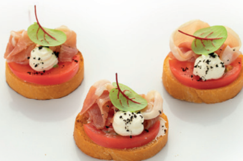
С ПАРМОЙ И ТОМАТАМИ 60г. 240₽