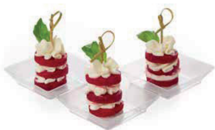
СВЕКЛА СО СЛИВОЧНЫМ 90г. 280₽ СЫРОМ И КЕДРОВЫМИ ОРЕШКАМИ