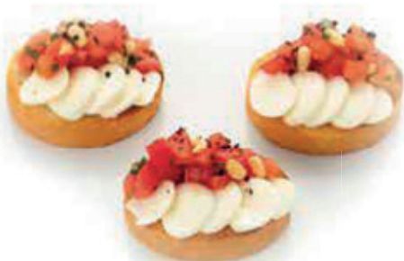
КАПРЕЗЕ 54г. 220₽