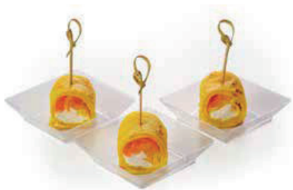
ВАНИЛЬНАЯ НЕРКА 180г. 620₽ С МАНГО В АЗИАТСКОМ БЛИНЧИКЕ