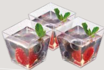
ЯГОДНЫЙ МИКС Нежное желе с белым вином, со свежей ягодой и мятой