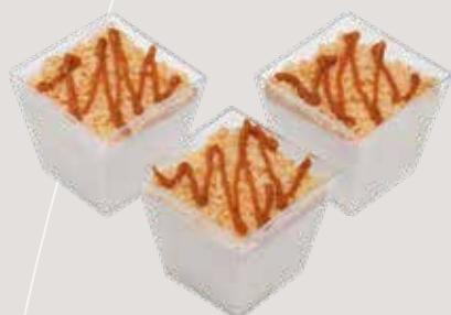
ЧИЗКЕЙК С СОЛЕНОЙ КАРАМЕЛЬЮ