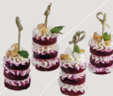
Свекла со сливочным сыром и кедровыми орешками