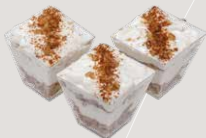
ПРЯНЫЙ МОРКОВНЫЙ ТОРТ С ГРЕЦКИМ ОРЕХОМ