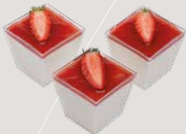
ДОЛЬЧЕ Творожный мусс с клубничным соусом