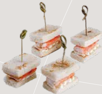
Фаланга краба на хлебной подушке