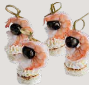
Креветка с маслиной и сливочным сыром на хлебной подушке