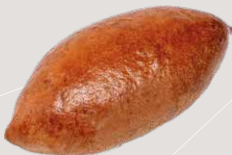
Пирожок с капустой