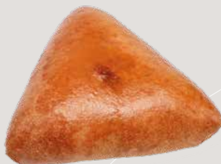
Пирожок с яйцом и луком