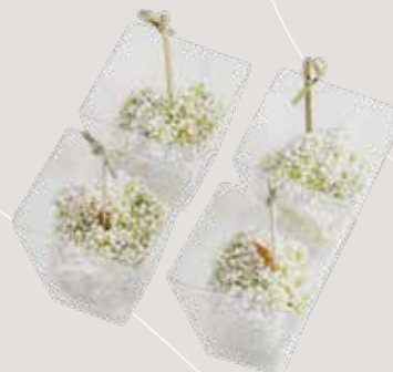
Креветка с муссом из авокадо Креветка, соус гуакамоле