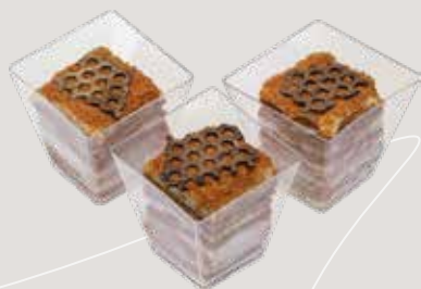
МЕДОВИК Медовые коржи, заварной крем