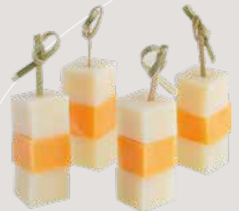
Ассорти сыров на шпажке: чеддер, гауда, пармезан