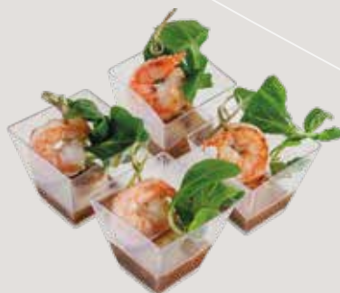
Гребешок с креветкой в соусе Тай