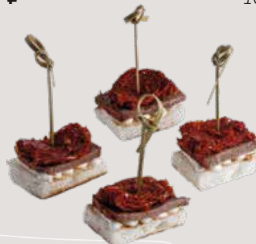
Ростбиф с вялеными томатами на хлебной подушке