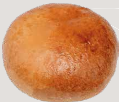
Пирожок с вишней