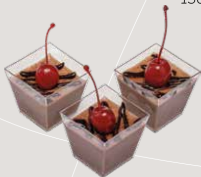
ZUMA GQ. Шоколадный мусс с коктейльной вишней