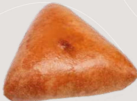
Пирожок с грибами