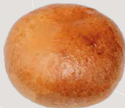
Пирожок с яблоками