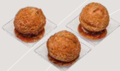
ПРОФИТРОЛИ С ЗАВАРНЫМ КРЕМОМ