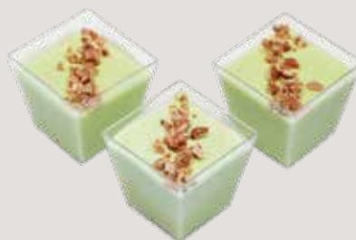
ПИСТАШ Фисташковый заварной крем, орех кешью