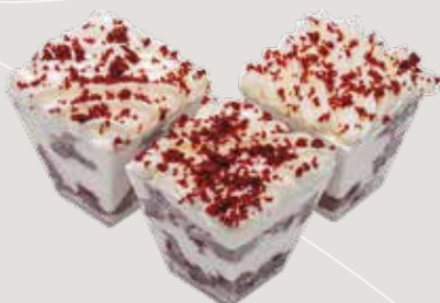
МИНИ-ТРАЙФЛ КРАСНЫЙ БАРХАТ