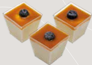
ЛЕТО Персиковый мусс, соус манго-маракуйя