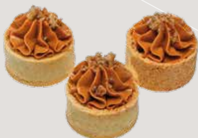
ТАРТАЛЕТКА КАРАМЕЛЬНАЯ Сырный крем с соленой карамелью и песочной крошкой