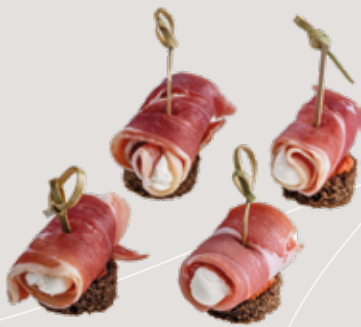
Парма с красным песто, творожным сыром на хлебной подушке